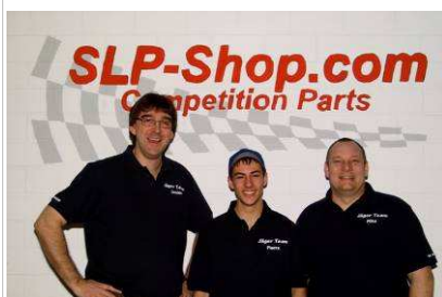
2. Platz Jäger-Team