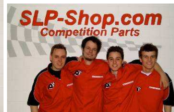
3. Platz Plastikquäler

Ich danke allen Teilnehmern für das tolle Rennen und freue mich auf ein Wiedersehen am 12/13.06.09 zum Einzelrennen in Alsdorf.