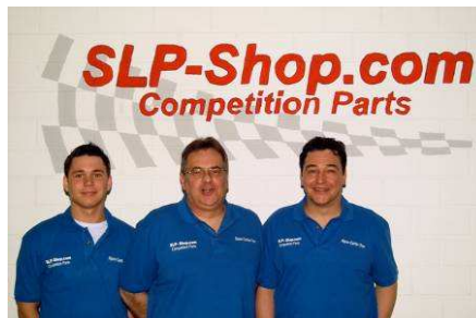
1. Platz No Limits